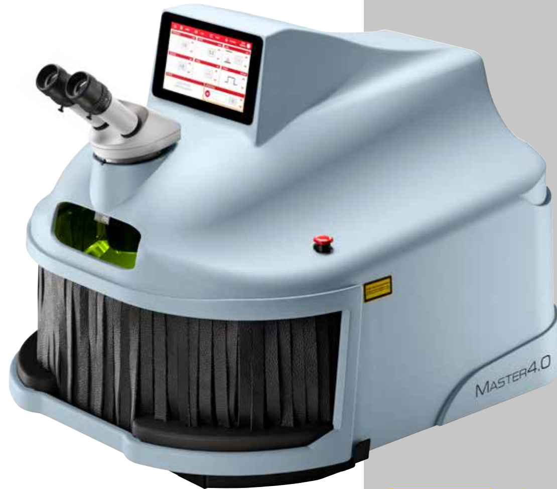
Pull-out trays/ object holder porta-oggetti estraibili